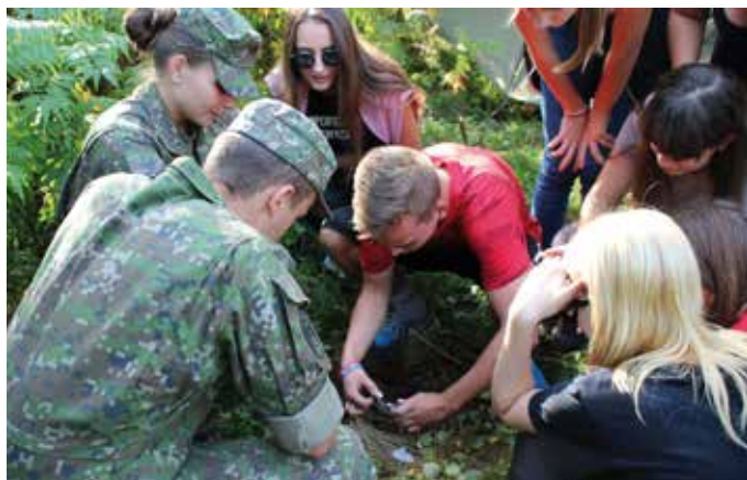
text: -hg-