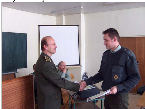
Odovzdávanie certifikátov účastníkom