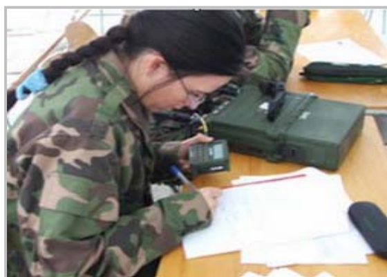
Účasť študentov na zamestnaní, rádiokomunikačná technika

Neoddeliteľnou súčasťou prípravy študentov AOS je aj neustála aktualizácia vyučovania o nové poznatky súčasného rozvoja vojenskej teórie a praxe. Tieto ciele katedra zabezpečenia velenia (KtZV) naplňa aj v rámci vzajomnej recipročnej spolupráce s 5. plukom špeciálneho určenia - VÚ 2790 Žilina. V poradí už piate vzájomné stretnutie formou praktického výcviku – kurzu, sa uskutočnilo v dňoch 14. - 18. februára 2005 . Príslušníci VÚ 2790, využili priestory KtZV na PSC Kaleníku na praktický zdokonaľovací výcvik a v rámci neho príslušníci KtZV vykonali odborný kurz. Obsahová náplň kurzu bola upravená podľa požiadaviek VÚ 2790 Žilina, so zameraním na odbornú problematiku: šírenie rádiových vln v pásme KV a VKV, - antény používané pre prevádzku v pásme KV a VKV, - plánovanie pracovných frekvencií programom VOACAP, rádiová prevádzka - prenos dát, prenos reči, dát a e-mail na krátke a stredné vzdialenosti.