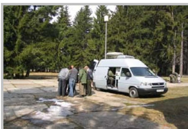
Mobilné meracie pracovisko na poľnom spojovacom cvičisku Kaleník