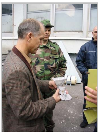
Odborná diskusia vedúceho katedry elektroniky s pracovníkmi technickej podpory frekvenčného manažmentu o konštrukcii lievnikovej antény pre pásmo 18 až 40 GHz