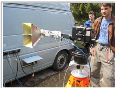
„Hornova anténa“ a jej príprava na meranie